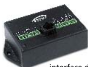
interface de connexion reliée au VIMATY 35S via un câble RJ45