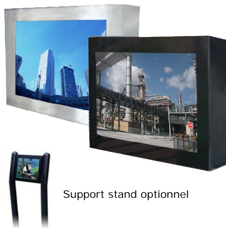
Support stand optionnel