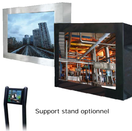
Support stand optionnel